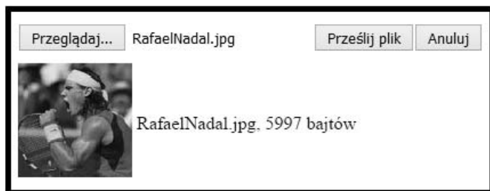
Rysunek 8.2. Przesyłanie plików na serwer z podglądem

Bardzo cenną i wygodną cechą komponentów do przesyłu plików jest możliwość wyświetlania podglądu obrazka przed jego przesłaniem na serwer. Poniższy rysunek 8.2 pokazuje rozwiązanie, które zaimplementujemy w tym punkcie rozdziału.